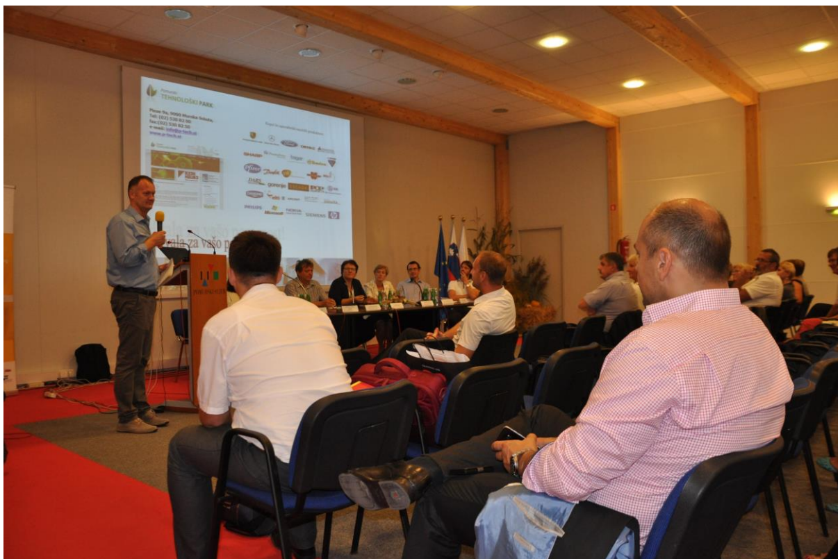
153 – Omizje 1. teme