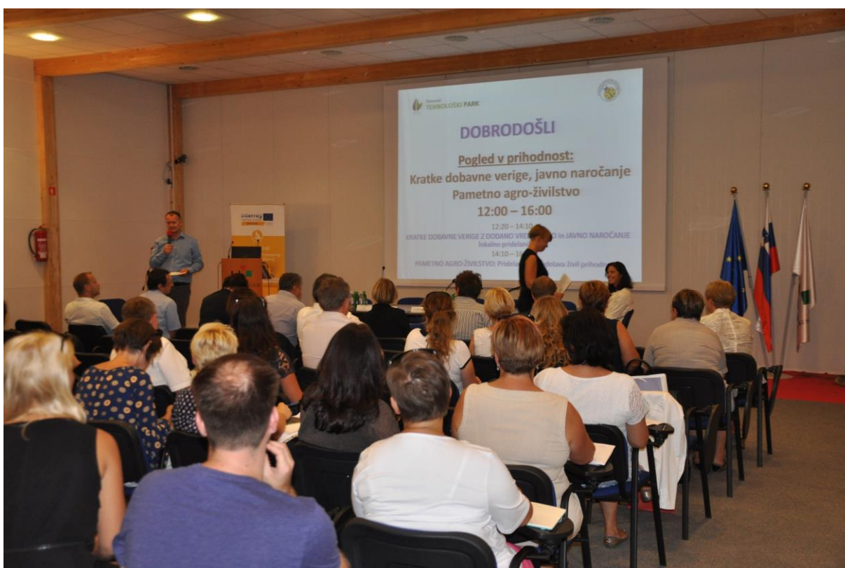
081 – Napoved 1. Okrogle mize: Kratke dobavne verige in javno naročanje