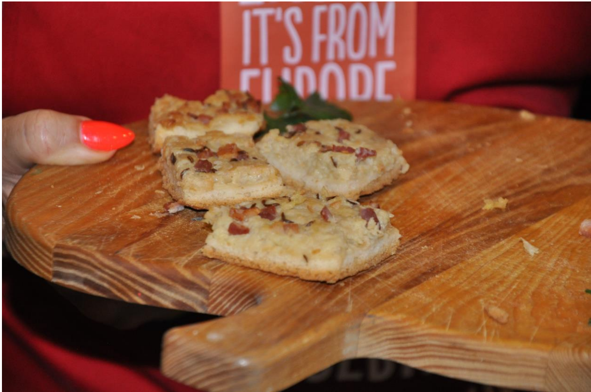
Ptujske dobrote - 3