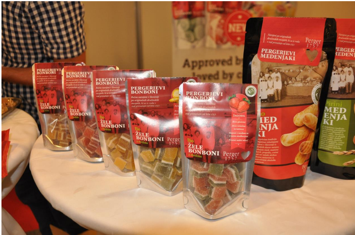
062 – Dobrote Perger 1757 d.o.o.