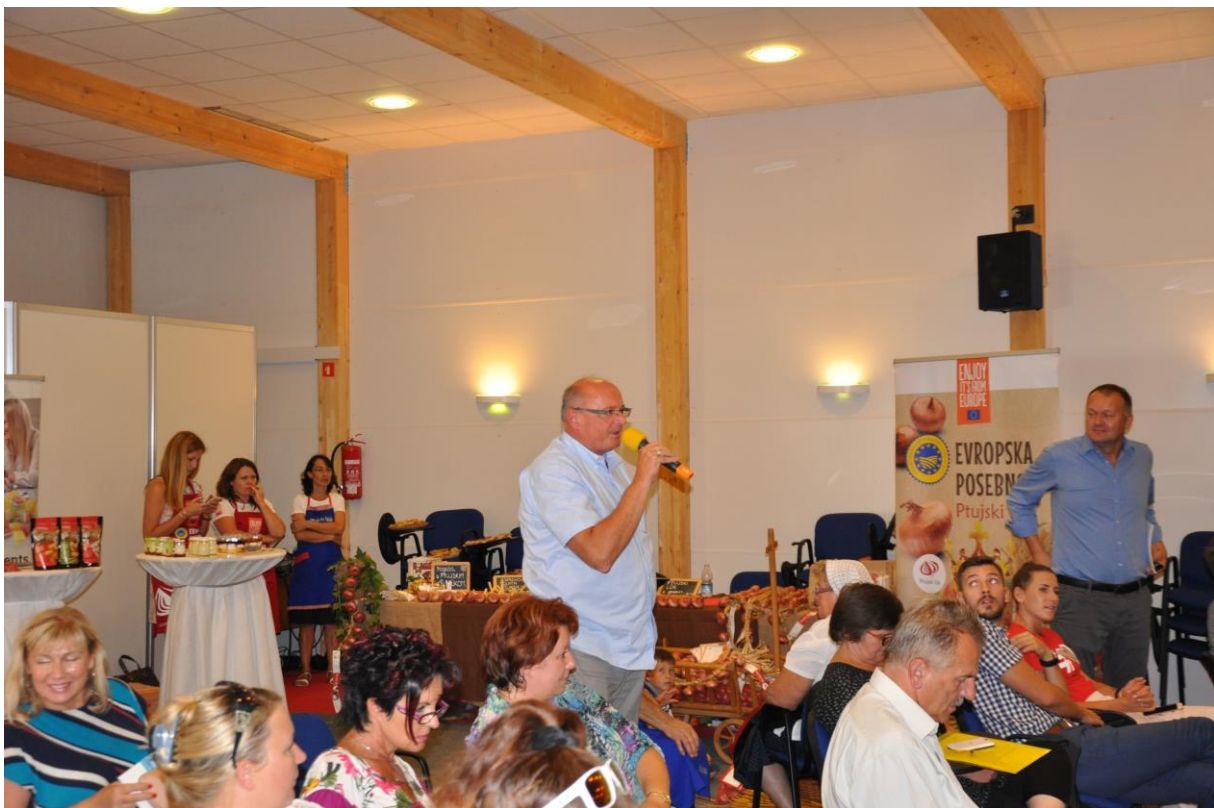
215 – Vprašanje iz publike