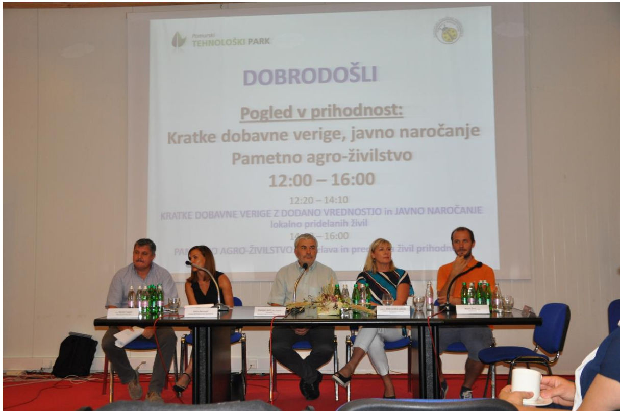
250 – Omizje Pametno agro-živilstvo