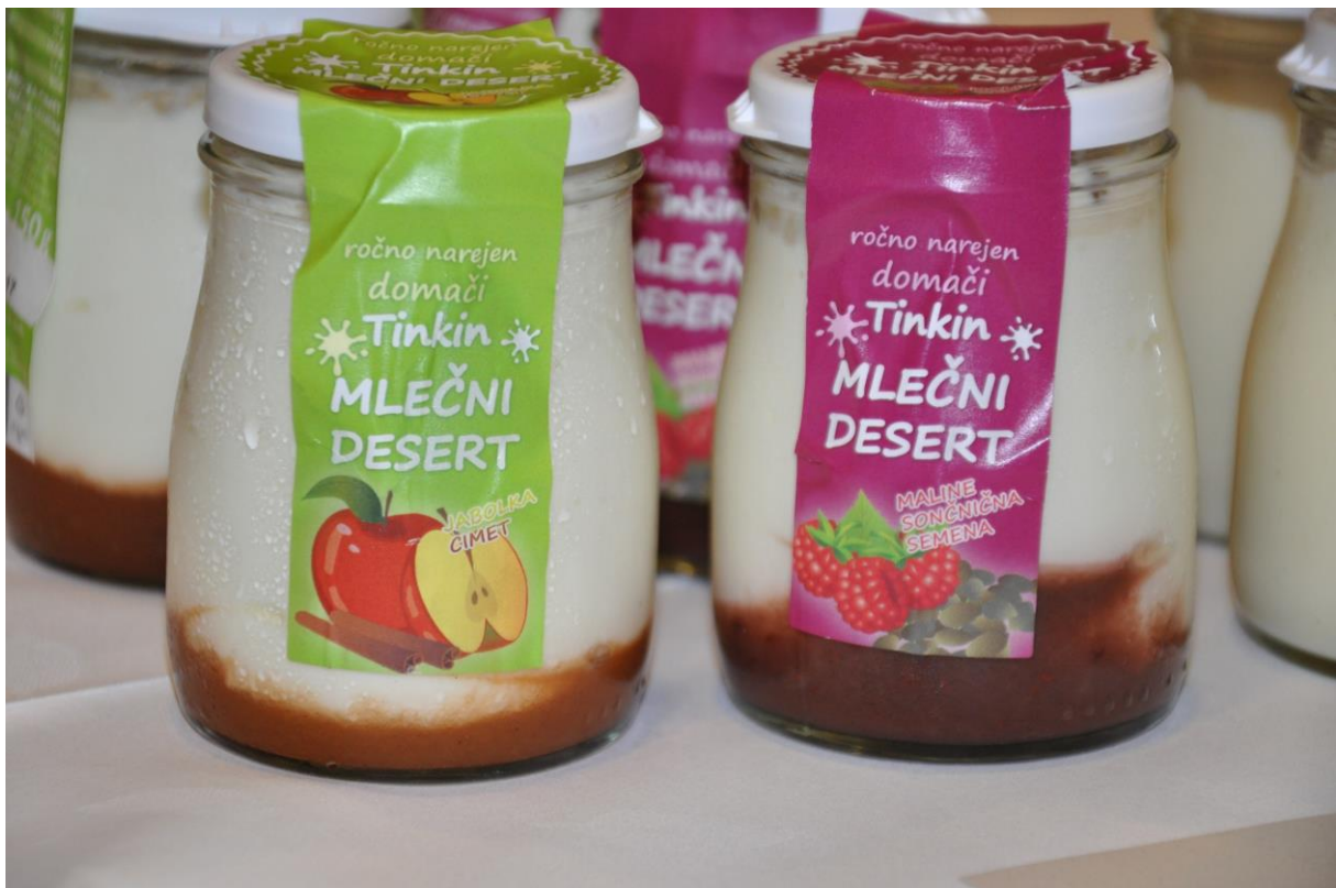
063- Mlečni desert Gorički raj d.o.o.