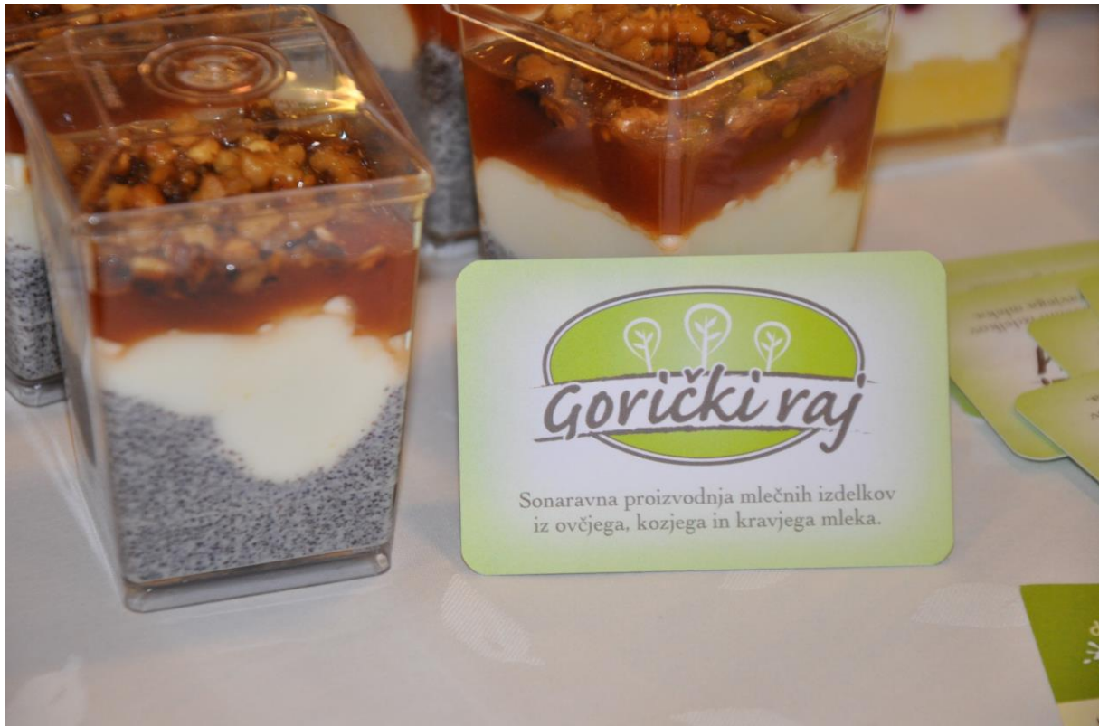
207 –Mlečno sadni deserti Gorički raj d.o.o.