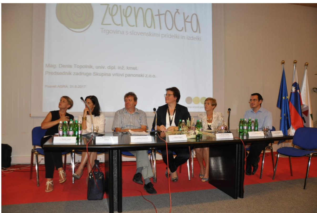
201 – Omizje bo predstavitvi Zelene točke