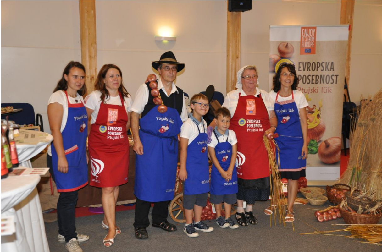
166- Ptujski lükarji