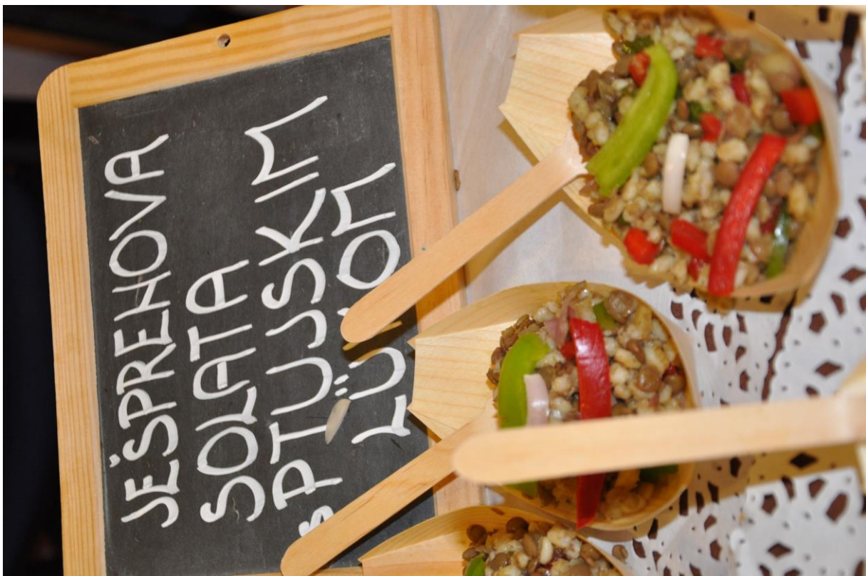
197- Ptujске dobrote 1